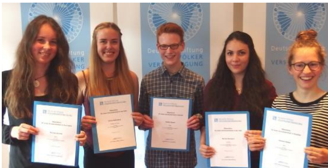
Stipendiaten der Stiftung Völkerverständigung

Online gibt es Tipps zur Finanzierung in der Schüleraustausch Stipendien Datenbank: https://www.aufindiewelt.de/stipendien