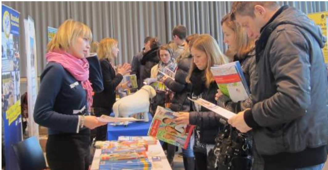
Beratung bei der AUF IN DIE WELT-Messe

Die gemeinnützige Stiftung Völkerverständigung bietet Schüler/innen, Familien und Pädagogen die Chance zur aktuellen Information.