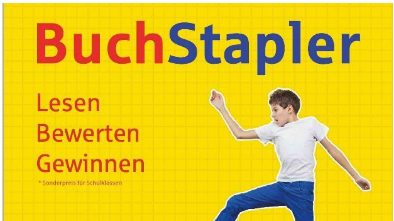
Buchstapler 2023