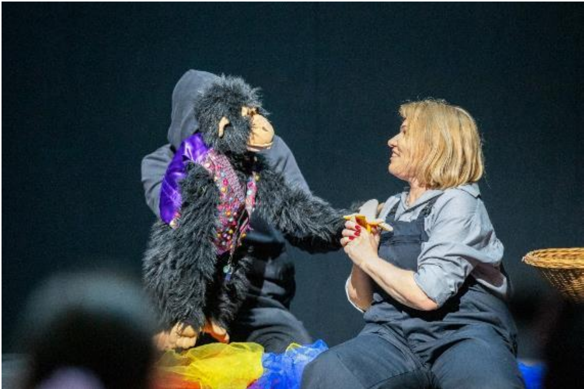
Foto aus der Opernkarussell-Inszenierung Farbenklänge .